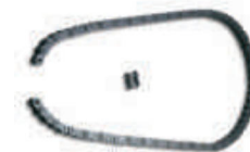
CRA4 łańcuch 5 m plus spinka do łańcucha