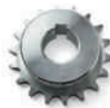
CRA7 koło zębate z 18 zębami