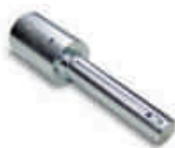
CRA9 adaptor do SUMO na wał: 1 1/4", 35mm, 40mm