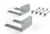
CRA8 dodatkowe uchwyty mocujące siłownik do ściany przy bocznym montażu - do bram rozsuwanych