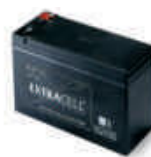
B12-B akumulator 12V 6.0 Ah