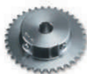
CRA6 koło zębate z 36 zębami