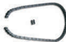
CRA3 łańcuch 1 m plus spinka do łańcucha