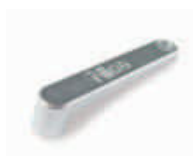
MEA5 dźwignia odblokująca do MEA3 (dodatkowa)