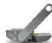
MEA3 mechanizm odblokowania awaryjnego przy pomocy dźwigni