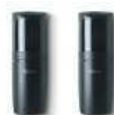
FT210 fotokomórki (para) nastawne z kątem 210°, zasięg 15 m