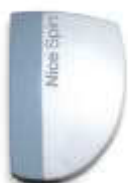
SPIN siłownik z wbudowaną centralą sterującą z odbiornikiem radiowym