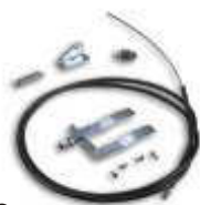
SPA 2 zestaw wysprzęglania z zewnątrz do SPIN/SPIDO

inne dodatkowe akcesoria - patrz strony 66 - 73