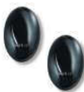
BF fotokomórka (para) zasięg 15-30m