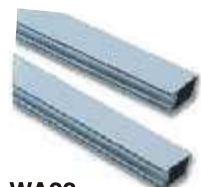
WA22 ramię aluminiowe, płaskie 2-częściowe, z łącznikiem, 36 x 94 x 3125 mm