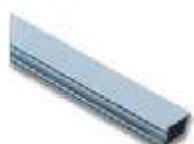
WA21 ramię aluminiowe, płaskie 36 x 94 x 6250 mm