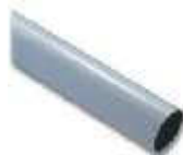
WA3 ramię aluminiowe, tubowe 70 x 4250 mm, zalecane do wietrznych miejsc