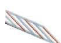
WA13 listwy aluminiowe, zabezpieczające, pod ramię płaskie, w odc. 2m