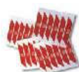
WA10 nalepki ostrzegawcze na ramię szlabanu (24 szt)