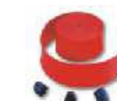
WA6 listwy ochronne, gumowe, czerwone, na ramię WA21, WA22