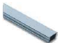
WA1 ramię aluminiowe, płaskie 36 x 73 x 4250 mm

inne dodatkowe akcesoria - patrz strony 66 - 73