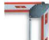
WA14 łącznik do ramienia tubowego - płaskiego WA1