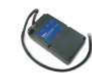
PS224 akumulator 24V 7.2 Ah z wbudowaną kartą ładowania