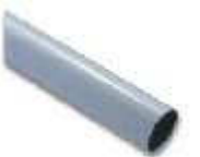
WA7 ramię aluminiowe, tubowe 90 x 6250 mm, zalecane do wietrznych miejsc