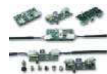
WA9 lampki ostrzegawcze LED na ramię, montowane w listwach ochronnych WA2/WA6 - 6 szt