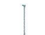
WA12 podpora ramienia ruchoma