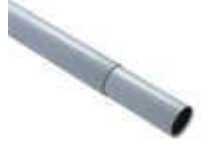
WA24 do SIGNO6 ramię aluminiowe, tubowe, 8500 mm z przeciwwagą, z podporą ruchomą WA12, z uchwytem mocującym do szlabanu