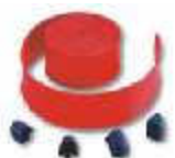
WA2 listwy ochronne, gumowe, czerwone, na ramię WA1