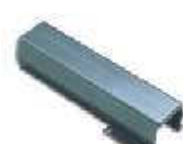
WA8 uchwyt mocujący do ramienia tubowego WA7