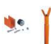
WA11 podpora ramienia stała, regulowana wysokość