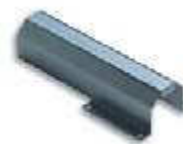
WA4 uchwyt mocujący do ramienia tubowego WA3